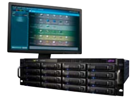
Avid ISIS 5000