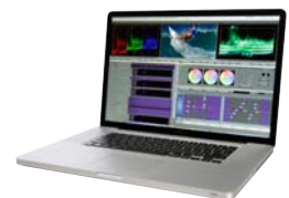
Avid Media Composer